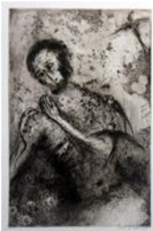
Job s vlaštovkami

Reynkovu básnickou tvorbu můžeme rozdělit do několika období. Sbírky z 20. let jsou ovlivněny expresionismem, autory, které sám překládal. V dalších sbírkách jej postupně (ale ne zcela) opouští a dílem čím dál více prostupuje zmíněný klid, pokoj a vztah k Bohu, lidem i všemu stvoření.