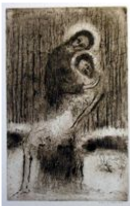
Pieta v zahradě

důležité, přestože byl proto tehdejšími režimem vytlačen i přes jeho kvality a zkušenosti na okraj. Dlouho patřil možná mezi „cíleně zapomenuté“ autory. Jeho víra se odráží jak v díle básnickém, tak výtvarném. Vedle jiných křesťanských básníků, kteří svou víru v Boha prezentují velkolepými frázemi s vznosným patosem, Reynek je považován právě za básníka ticha a kontemplace, meditace, básníka, který vnímá Boží přítomnost v jeho blízkém okolí, statku, přírodě, výjevech kolem sebe. Neužívá slov více, než je třeba. Období poznamenané válkami a utlačováním, v němž lidé přemítají nad blížící se apokalypsou, prožívá s vzácným pokojem, děsivá všudypřítomná smrt je pro něj čím dál více „smrtí – vykupitelkou“.